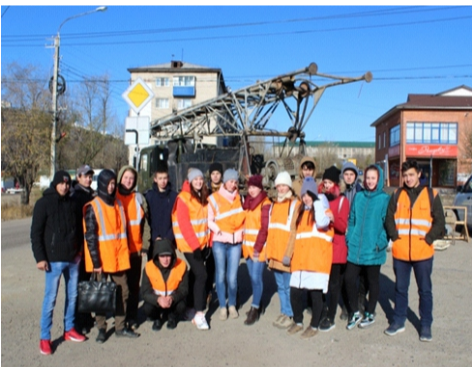
ПРАКТИКА – ВСЕМУ ГОЛОВА!