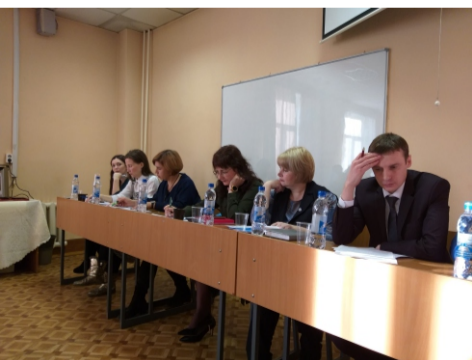
ВЫПУСКНИКИ НА СТАРТЕ КАРЬЕРНОГО ПУТИ РАСПРЕДЕЛЕНИЕ СТУДЕНТОВ – 2020