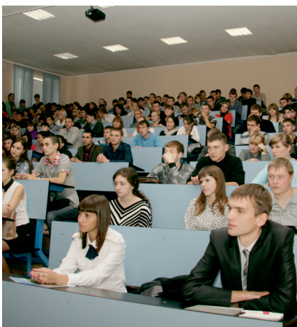
СЕССИЯ: ОСНОВНЫЕ ПРАВИЛА УСПЕШНОЙ СДАЧИ