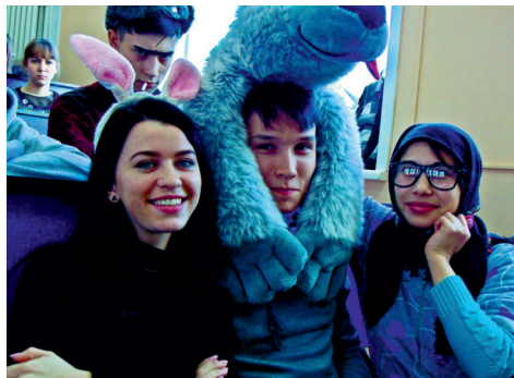
ТВОРЧЕСКИЕ ГРАНИ «ЧЕЛОВЕЧЕСКИХ» НАУК. НЕДЕЛЯ КАФЕДРЫ «ГУМАНИТАРНЫЕ НАУКИ» В ЗАБИЖТ

Последняя ноябрьская неделя и начало декабря ознаменовались появлением новой и, будем надеяться, продолжительной традиции в нашем институте. Впервые ЗаБИЖТ провёл в своих стенах Дни гуманитарных наук, инициированных одноименной кафедрой с простой, но значимой целью: приобщить студентов к богатствам человеческой культуры в самых разных