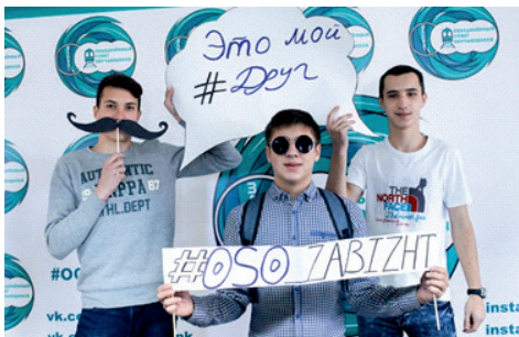
ВНЕУЧЕБНАЯ ДЕЯТЕЛЬНОСТЬ ИНСТИТУТА ЗА НОЯБРЬ